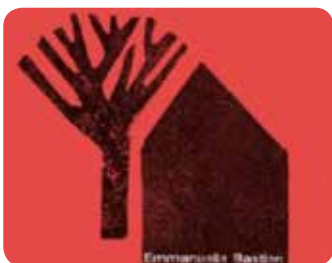
Il était plusieurs fois, E. Bastien