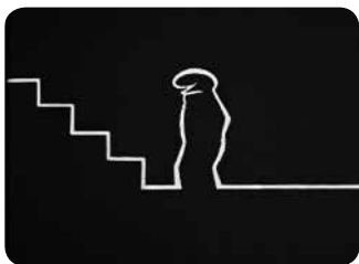
La Linea, Osvaldo Cavandoli