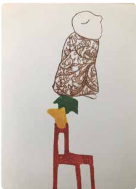
Bonhomme, sa maison, et pluie et pluie, E. Bastien