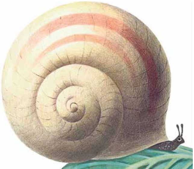
La maison la plus grande du monde, Leo Lionni