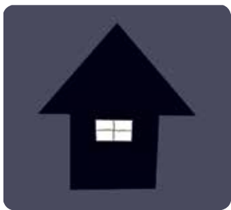
Le livre de nuit, Yaé Haga